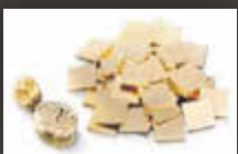
Dentalplättchen & Gold Staub