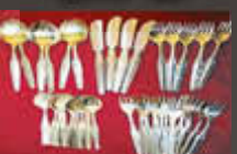
Silberbestecke & Versilbert

Ankauf von Silber aller Art und in jeglicher Form