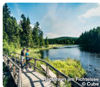
Radfahren am Fichtelsee

Westlich von Bayreuth gelegen, bietet Eckersdorf ein Wanderwegenetz von über 100 km, das Sie schnell ins Herz der Fränkischen Schweiz mit ihrer herrlichen Landschaft führt. TreffpunktDeutschland.de/eckersdorf