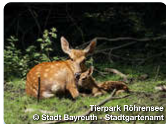
Tierpark Röhrensee

International bekannt ist die oberfränkische Stadt Bayreuth durch die Wagner-Festspiele. Sicher nicht das einzige Highlight, das die Herzen der Opernfreunde höher schlagen lässt. TreffpunktDeutschland.de/bayreuth