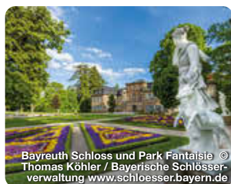
Bayreuth Schloss und Park Fantaisie

Genießen Sie ungeahnte Aussichten und Einblicke schon während der gut 700 m langen Bergauffahrt bevor Sie sich in die über 1.000 m lange, überaus abwechslungsreiche Abfahrt stürzen. Fröbershammer 27, Bischofsgrün