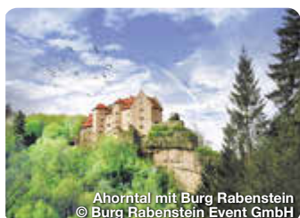
Ahorntal mit Burg Rabenstein