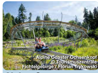
Alpine Coaster Ochsenkopf

Parkanlage im Süden Bayreuths begeistert alle Generationen. Mit Tieren wie Kängurus und Flamingos, botanischen Besonderheiten und großem Spielplatz am See. Pottensteiner Str., Bayreuth