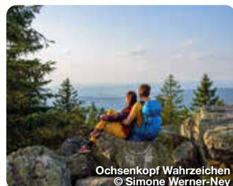
Ochsenkopf Wahrzeichen

Das Museum in Plech gehört mit über 250 Quadratmetern Ausstellungsfläche heute schon zu den bedeutendsten Foto-Museen Europas. Über 30.000 Sammlungsstücke, darunter 9.000 Fotoapparate wurden zusammengetragen. (November bis Februar geschlossen.) Schulstr. 8, Plech