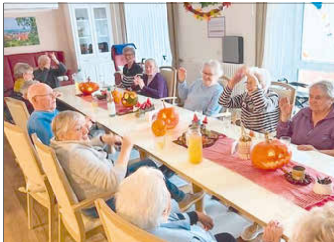
Gemeinschaft erleben, Neues ausprobieren, Ruhe finden oder kreativ sein – unsere Tagespflege bietet für jeden genau das Richtige.