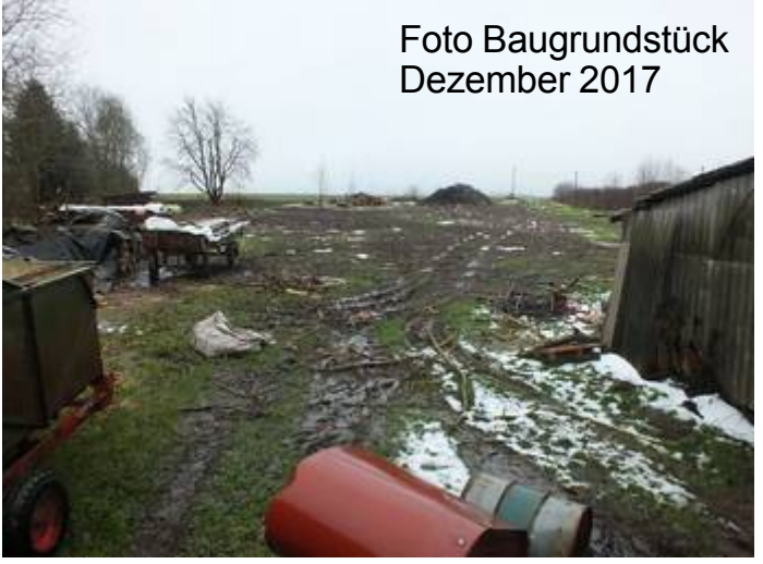
Foto Baugrundstück Dezember 2017