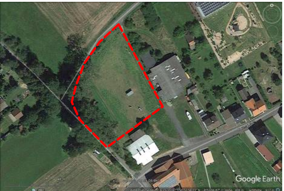
Luftbild mit Abgrenzung der Eingriffs- / Ausgleichsfläche (ohne Maßstab)

C) KOMPENSATIONSDEFIZIT: 90.006 WP - 51.243 WP = - 38.763 WP Entspricht Ausgleichszahlung: 38.763 x 0,35 € = 13.567 €