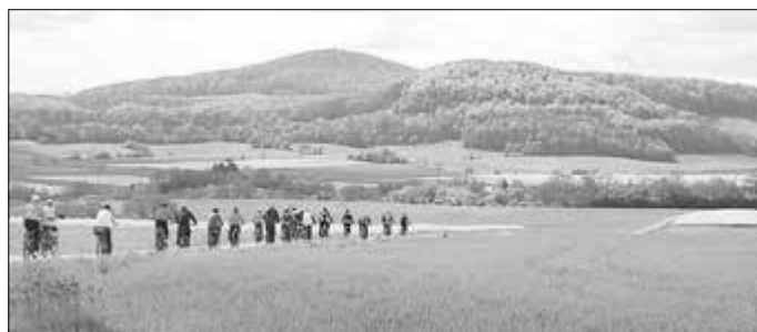
Kuppenrhöner Anradeln mit Blick auf den Soisberg

Wir freuen uns auf viele Teilnehmer und Besucher. Weitere Informationen finden sich auf unserer Webseite www.kuppenrhoen.de .